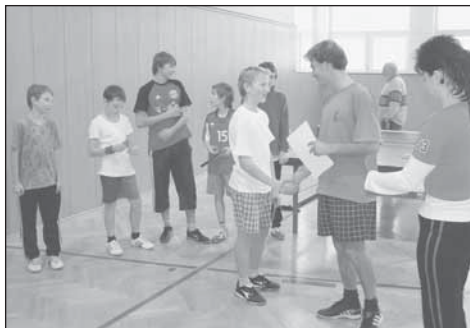
Vyhlášení výsledků juniorské kategorie

V sobotu 28. 12. 2005 se sešlo asi 25 sportovců v tělocvičně místní ZŠ, aby protáhli svá těla po vánočním lenošení a poměřili si vzájemně své ping-pongové dovednosti. Letošní III. ročník turnaje byl kromě kategorie mužů a ženy doplněn kategorií juniorů do 15 let věku. Nejvíce obsazenou kategorií byla opět kategorie mužů, která byla rozložena do skupin, ze kterých teprve vyšlo finálové družstvo. Ostatní kategorie byly odehrány systémem každý s každým a výsledky byly známy až v odpoledních hodinách, kdy se po předání cen a závěru oficiálního turnaje pokračovalo ve volných dvou a čtyřhrách až do večerních hodin. Celý den byl dobře zabezpečen i po stránce občerstvení, takže soutěžící mohli průběžně doplňovat vynaložené síly. Všichni zúčastnění sportovci se rozešli s tím, že na Velikonoce si turnaj zopakují a ověří si stabilitu své formy.