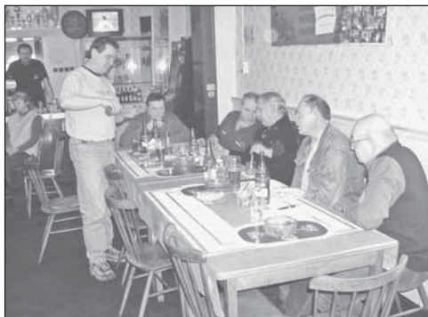
Těžké rozhodnout – přísná košтовací porota

Po ukončení obou soutěží došlo k vyhlášení výsledků a na pomyslných stupních vítězů byly předány