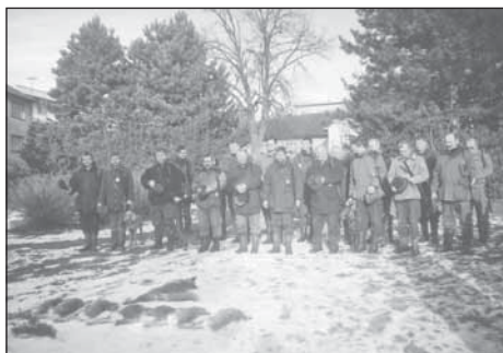
Střelci MS Horní Roveň při výřadu ulovené zvěře na přilepské návsi