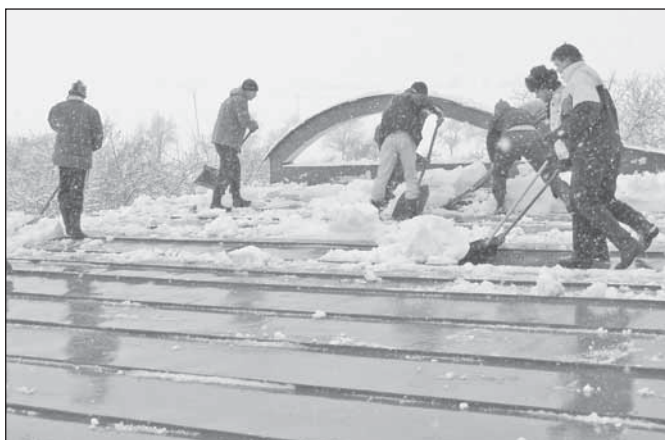
Odklizení sněhu ze střechy přtlepské tělocvičny – téměř hotovo