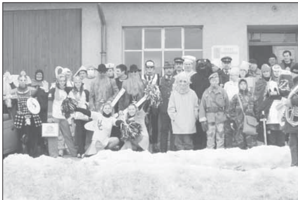
Řazení maškarního průvodu před provozovnou ČZS

To letošní vyšlo na sobotu 18. února. Časně ráno se začali účastníci maš-