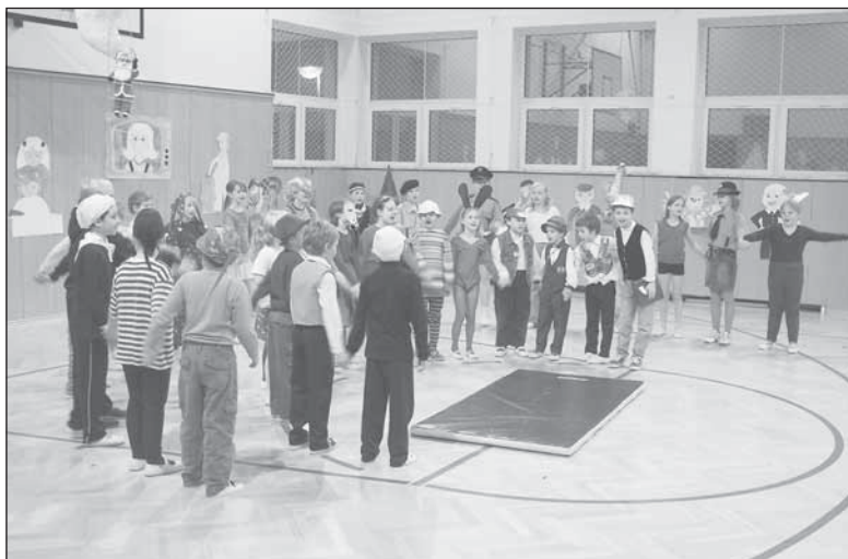
Ten dělá to a ten zas tohle – žáci ZŠ se svým programem

Po skončení besídky uspořádala obec pro všechny malé i velké přlépáky ohňostroj na školním hřišti, který se i přes nepřízeň počasí vydařil a líbil.