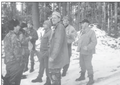
Posilující se příleptí honci