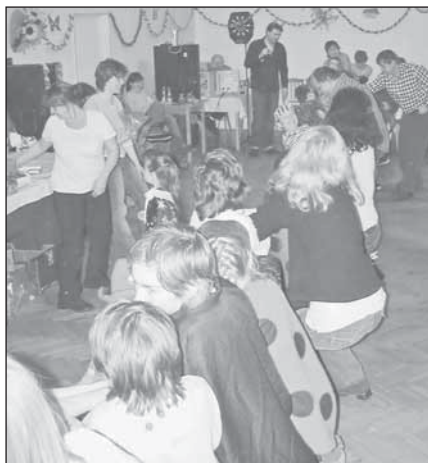
Přetahování lanem opět slavilo úspěch

Ano, pochopili jste správně, řeč je o Šibířkách, které pro děti uspořádal Klub rodičů při Základní škole Přílepy, za což patří této partě nadšených a ochotných lidí velký dík. Poděkování si zaslouží také sponzoři této akce, kteří umožnili připravené velké tomboly. Každé dítě si tak mohlo odnést domů kromě veselých zážitků i nějakou tu maličkost.