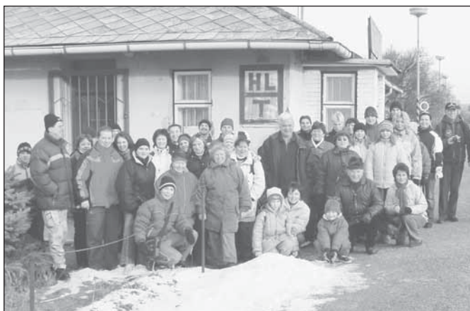
Účastníci „Rostova výšlapu 2006“ na vlakové zastávce v Dobroticích